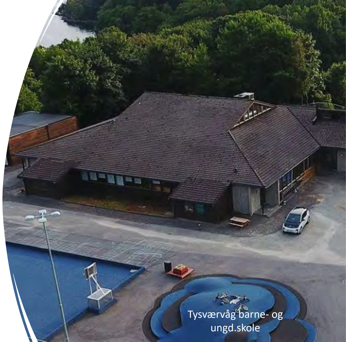
Tysværvåg barne- og ungd.skole